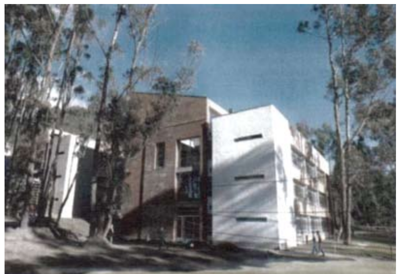
Edificio de la Facultad de Ciencias Económicas y Negocios "Recién Inaugurado"