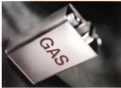
Cuadro N° 4 SUBSIDIO A LOS COMBUSTIBLES

Siendo así, lo que más preocupa es el impresionante subsidio a los combustibles. Ascende a USD 2.315 millones y no está claramente financiado en el Presupuesto General del Estado. La estructura del subsidio es la siguiente: