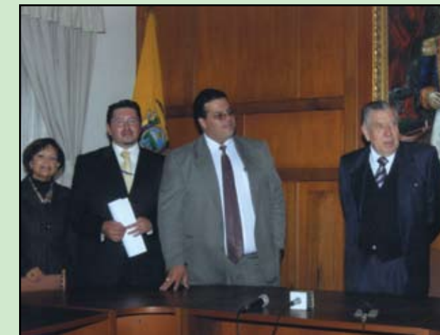
Facultad de Ciencias Sociales y Comunicación de la Universidad Tecnológica Equinoccial, y el Canal de Televisión RTU firman un convenio para que estudiantes de la Carrera de Periodismo puedan adentrarse en la Carrera con un conocimiento teórico y además práctico.